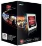
AMD A6-7400K BLACK A SERIES, AMD A6, 3,5 GHZ, SOCKET FM2+, DDR3-SDRAM, 1866 MHZ