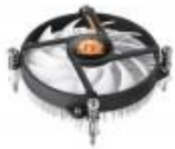
THERMALTAKE GRAVITY I1, ENFRIADOR, PROCESADOR, 9,2 CM