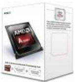
AMD A4-7300 A SERIES, AMD A4, 3,8 GHZ, SOCKET FM2+, DDR3-SDRAM, 1600 MHZ