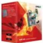
AMD A8-5600K A SERIES, AMD A8, 3,6 GHZ, SOCKET FM2, DDR3-SDRAM, 1866 MHZ