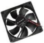
ACTECK AV-900, VENTILADOR, CARCASA DEL ORDENADOR, 9 CM