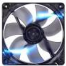
THERMALTAKE PURE S 12 LED, ENFRIADOR, CARCASA DEL ORDENADOR, 12 CM