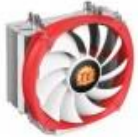
THERMALTAKE NIC L31, ENFRIADOR, PROCESADOR, 12 CM